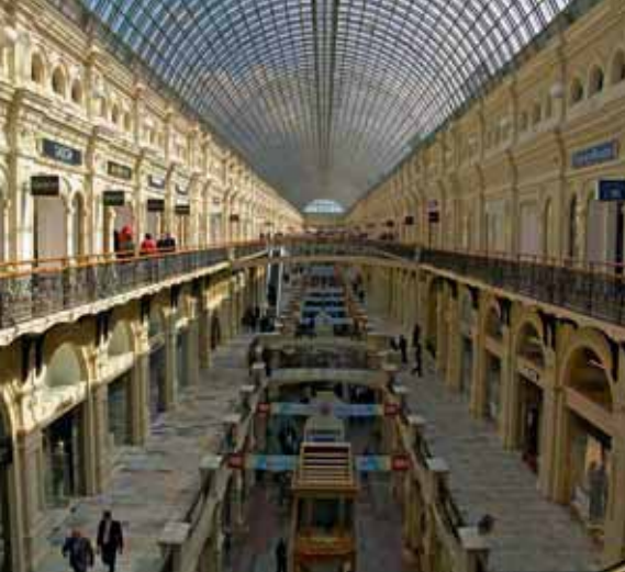
Das Kaufhaus GUM am Roten Platz