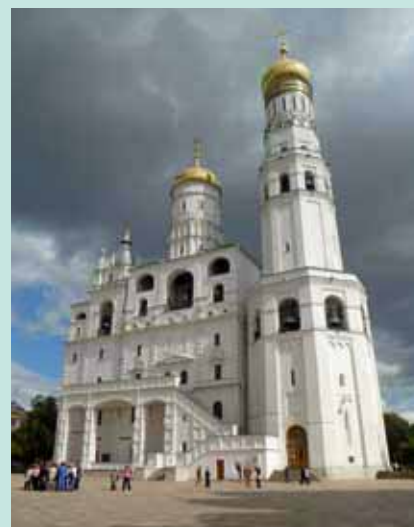
Der Turm «Iwan der Grosse» im Kreml

Preise pro Person in CHF inkl. Frühstück DZ EZ 01.01.–29.02. / 01.07.–31.08.12 180.– 325.– 01.03.–30.06. / 01.09.–31.12.12 215.– 395.–