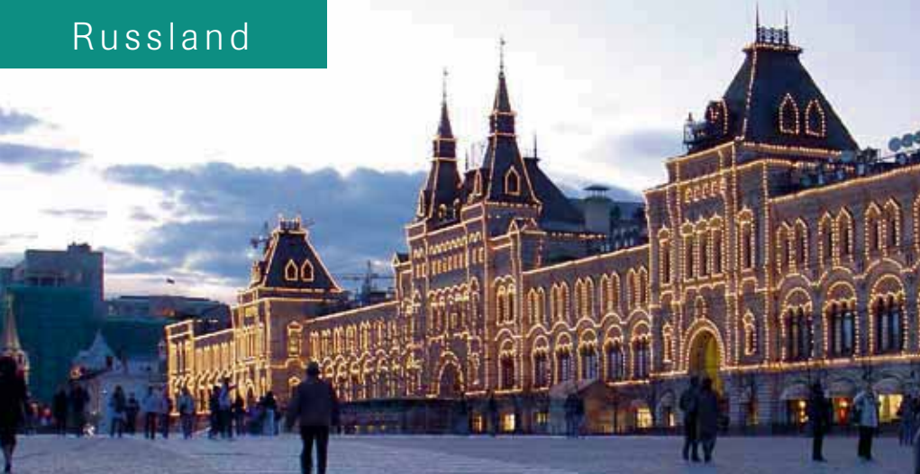
Das Einkaufszentrum GUM festlich beleuchtet