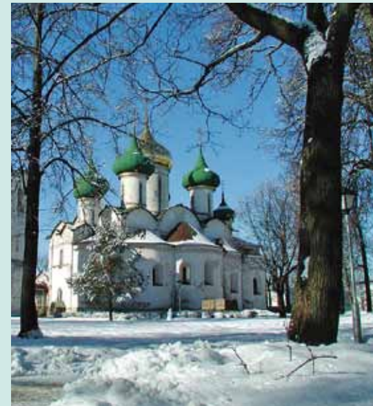
Suzdal im Winter