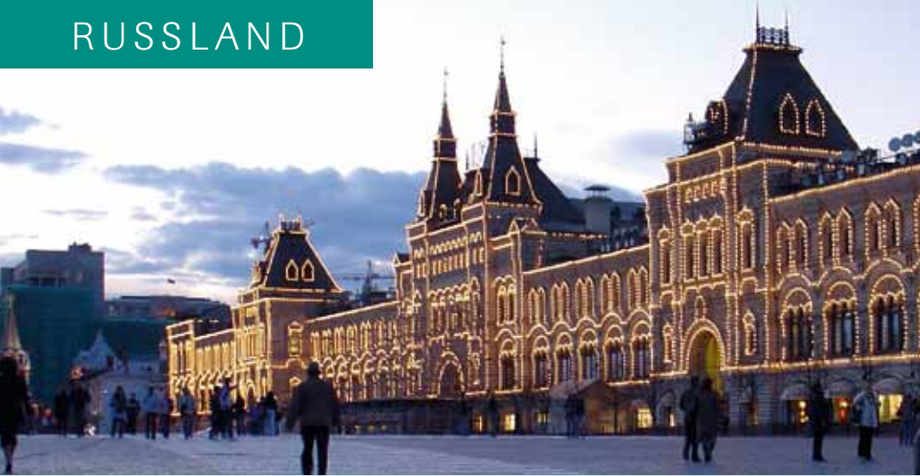
Das Einkaufszentrum GUM festlich beleuchtet