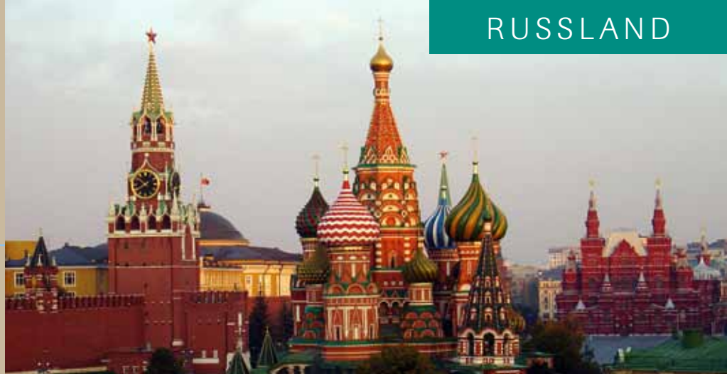
Die Basiliuskathedrale liegt unmittelbar beim Roten Platz