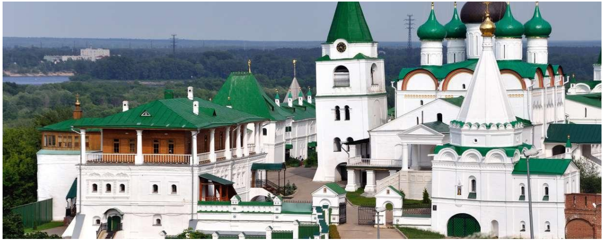
Nischni Nowgorod, das Architektur- Mekka Russlands