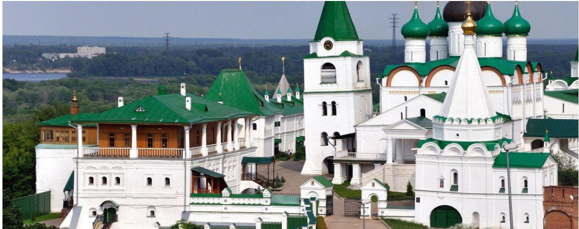
Nischni Nowgorod, das Architektur- Mekka Russlands